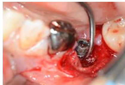
スレッドへのスケーリング (純チタンまたは、チタン合金製のチップを使用)

また現在、骨再生・軟組織再生の分野でヨーロッパを中心に飛躍的な広がりを見せている新しい材料と、独自の技術を駆使しながら、インプラントのマーケットリーダーとして急速に成長しているsweden&martinaインプラントのご紹介もさせていただきます。この機会に是非ともご参加賜りますよう宜しくお願い申し上げます。