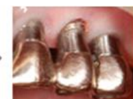
出血が止まり、歯肉状態 良好。