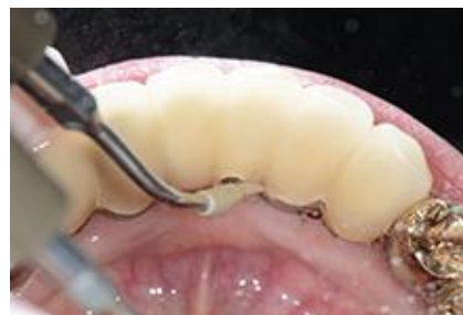
上部構造へのスケーリング (Peek製のチップを使用)