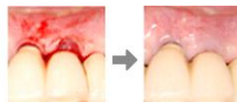
インプラント周囲から 出血が見られます。