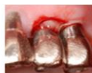
インプラントから 出血が見られます。