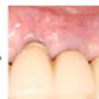
2週間後出血が止まり 歯肉状態良好。